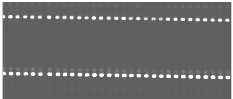
14 号光谱仪红区在定宽狭缝模式下定标灯的灯谱图